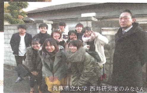
兵庫県立大学 西井研究室のみなさん