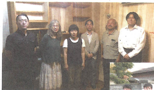
建築士・大工など 専門家と関係者

空き家を地域で活かすために、現所有者である妹さんから、お姉さんの生前の想いを伺い、地域で音楽を楽しむなどの憩いの場に生まれ変わりました。